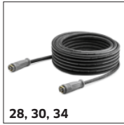
28, 30, 34